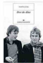
DES DE DINS MARTIN AMIS ANAGRAMA TRADUCCIÓ DE FERRAN RÀFOLS GESA 600 PÀG./24,90 €

Conscient d'haver escrit un llibre excessiu i un punt monstruós –per la mescla de temes dispers, la pluralitat de mirades i la bigarrada paleta d'estats d'ànim i de tons, que li confereixen un aspecte de Frankenstein atètic i glamurós, però frankensteinia al cap i a la fi–, Amis recomana al prelu di de llegir Des de dins a poca a poca. I afegeix: "Ja planyo els pobres desgraciats (els correctors i ressenyadors) que l'hauran de llegir d'una tirada, i contra rellocte". M'ha tocat ser un d'aquests pobres desgraciats i puc dir-te, Martin, que no cal que em planyis. De vegades ets pedant i una mica pesat, però escrius amb una gràcia única, has estimat molt i t'han estimat molt –i saps explicar festivament tot aquest devesall d'amor– i ets brillant d'una manera insòlitàment divertida. O sigui que no worries : llegint-te sempre m'ho passo pipa. ♦♦