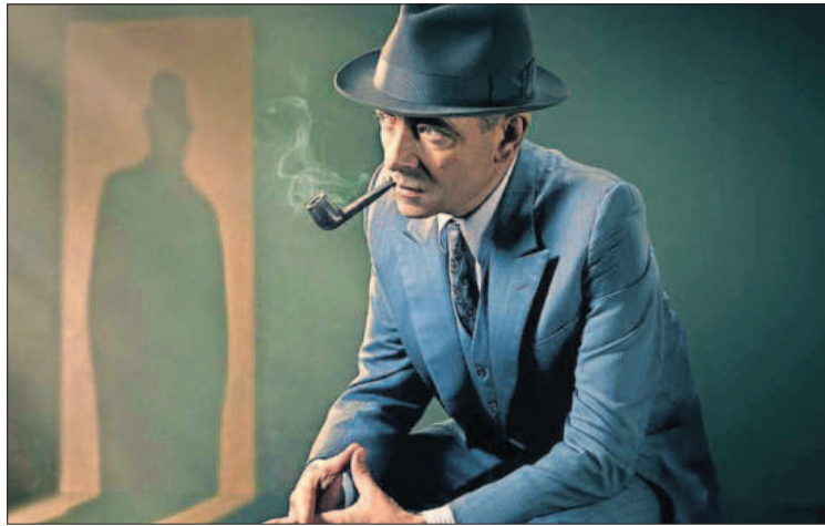
El actor Rowan Atkinson, como Maigret en la serie televisiva homónima.

Pero el económico es solo un aspecto de un plan urdido al milímetro. Hombre público y excesivo, encierra en sí una paradoja: realmente sabemos muy poco de él. Su vida es una constante exhibición llena de sombras, un periplo que es su mejor creación literaria y que se confunde con su obra. No es recomendable buscar, ni siquiera en las novelas que parecen más personales, los rastros perdidos de esta vida excesiva en todo. “Mi relación con la obra de mi padre no es complicada, pero sí paradójica. Cuando empecé a leerlo sentía cierto malestar con algunos elementos que no eran biográficos, pero que yo reconocía. Son características de los personajes porque las historias nunca eran