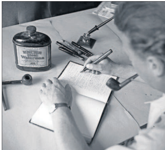
Simenon en el castillo de Terre-Neuve, Francia.

biográficas, pero estaban ahí”, reconocía su hijo a este diario en 2019. Millonario, famoso, mujeriego, en sus análisis de la miseria del alma humana se excluyen sus divorcios, la muerte de su hija o el colaboracionismo de su hermano. Habrían quedado demasiado melodramáticos, coinciden sus biógrafos.