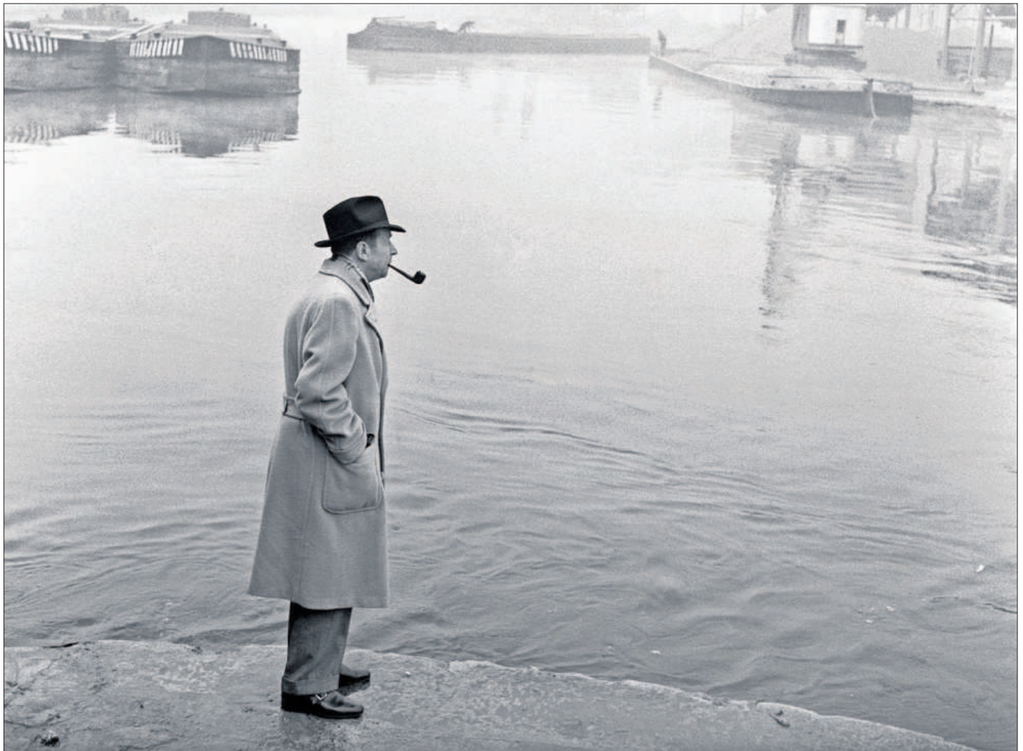
Georges Simenon, a orillas de un canal de Milán en los años cincuenta.