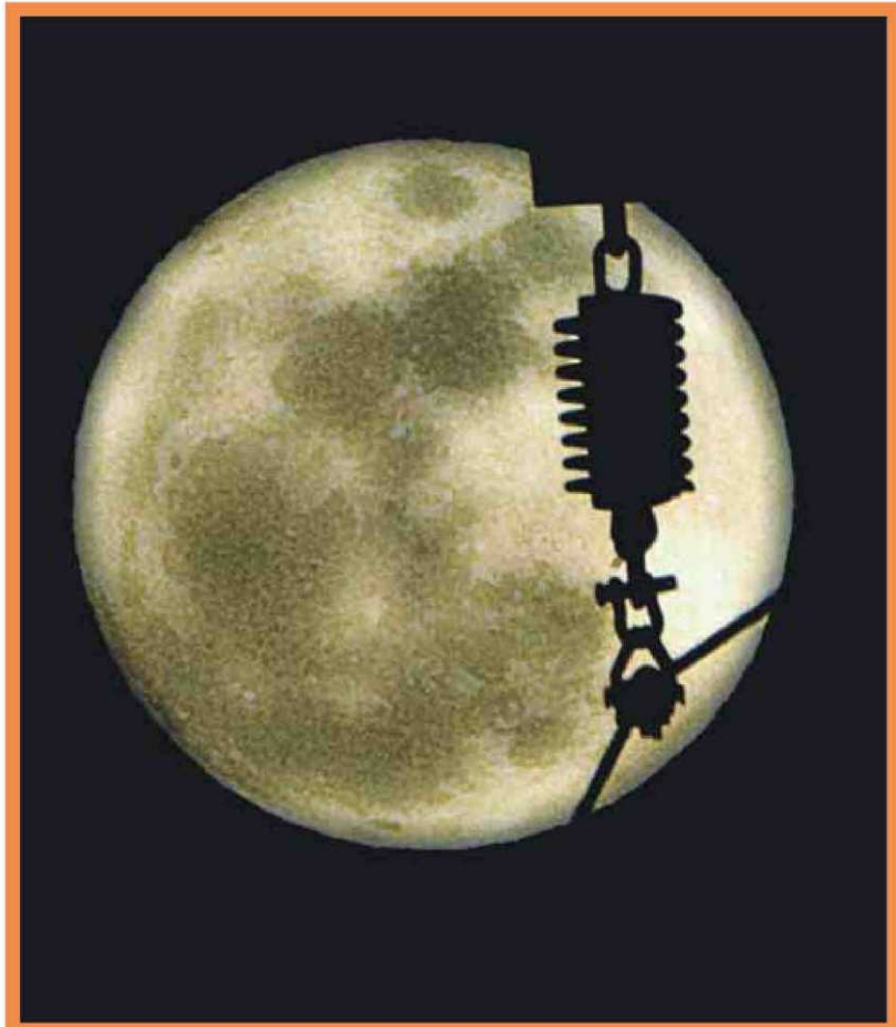
Lluna plena. La lluna també és sinònim de somnis i de misteri ➔ LLUÍS SERRAT

Autor: Toni Pou Editorial: Anagrama Pàgines: 224 Preu: 18,90 euros