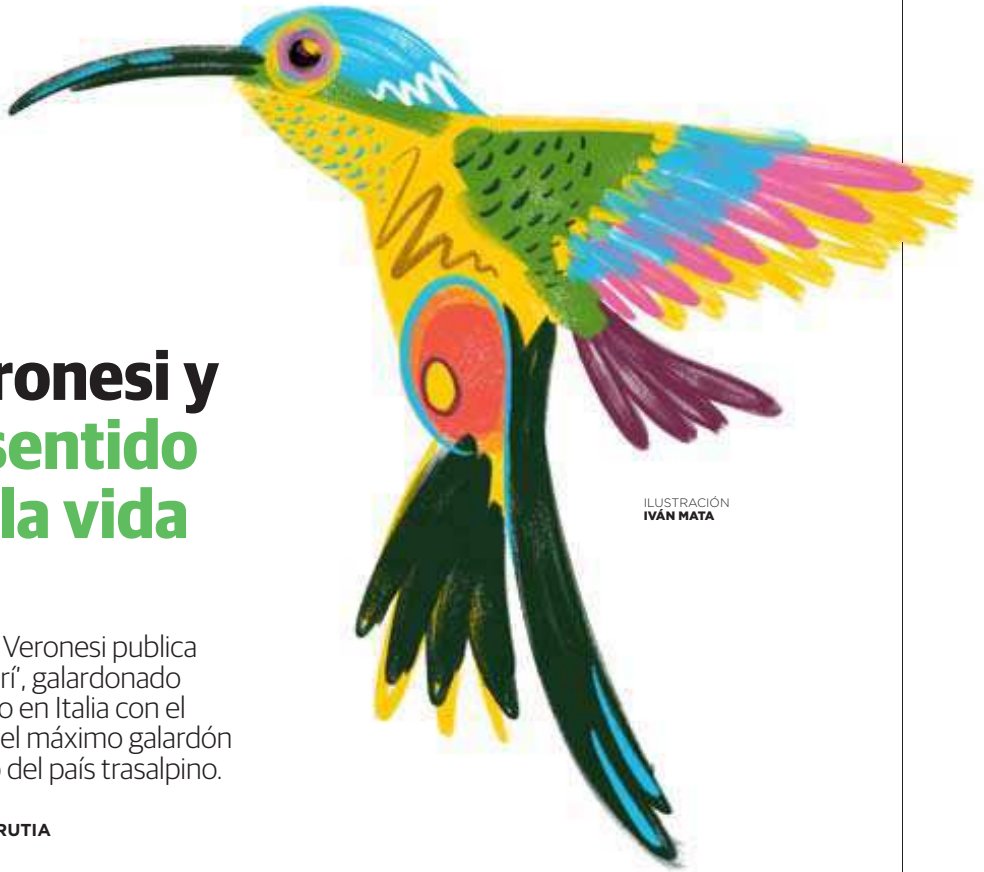
ILUSTRACIÓN IVÁN MATA

S andro Veronesi (Florencia, 1959) ha obtenido este año por segunda vez –la primera, con ‘Caos calmo’–, el prestigioso premio Strega con ‘El Colibrí’, una novela que narra con intensidad dramática sostenida los estragos que puede originar el amor, el que pudo ser y no fue. Es también una historia sobre cómo gestionamos el dolor y las pérdidas, –por ejemplo, «esa llamada que todos los padres temen como temen el infierno»– los errores que se solidifican, sea a través de la parálisis y la inacción o como impulso para recomponer la existencia. «¿Cómo contar el nacimiento de un gran amor cuando sabemos que acabó mal?, o cuando «desde el principio, todo fue un error, una ficción. Esto sucede a menudo cuando se forman las parejas y luego las familias», y la ingenuidad se convierte en culpa; o «la infelicidad que persiste aunque la elijamos como mal menor. Y sin embargo, ‘El colibrí’ celebra también el optimismo, los arresos emocionales para superar las situaciones de duelo, para encontrar un sentido a una existencia marcada por vicisitudes negativas.