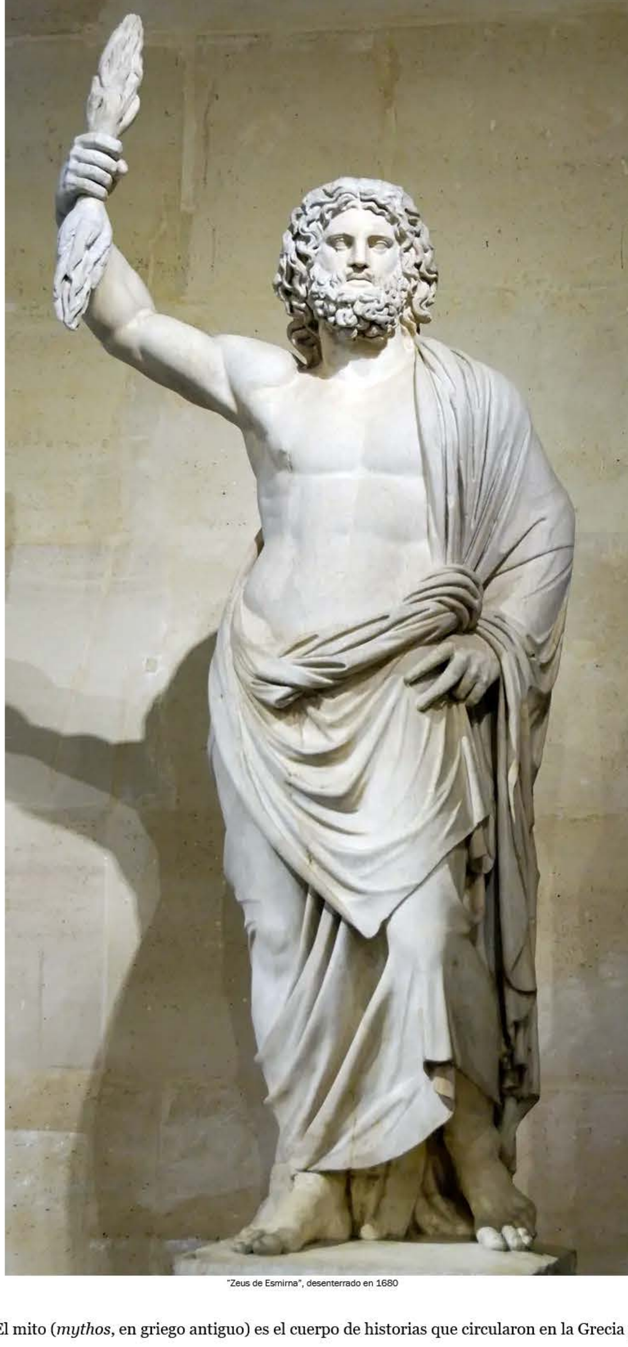
"Zeus de Esmirna", desenterrado en 1690

En resumen: en lugar de modelos de comportamiento ejemplar, Zeus, Hera, Apolo y Afrodita eran esencialmente humanos. Como nosotros, se amaban, se odiaban y se envidiaban unos a otros; como nosotros, sentían intensos afecto, celos y orgullo. Los dioses y diosas griegos nunca aspiraron a predicar con el ejemplo. Más bien, superaron a los humanos en querer salirse con la suya.