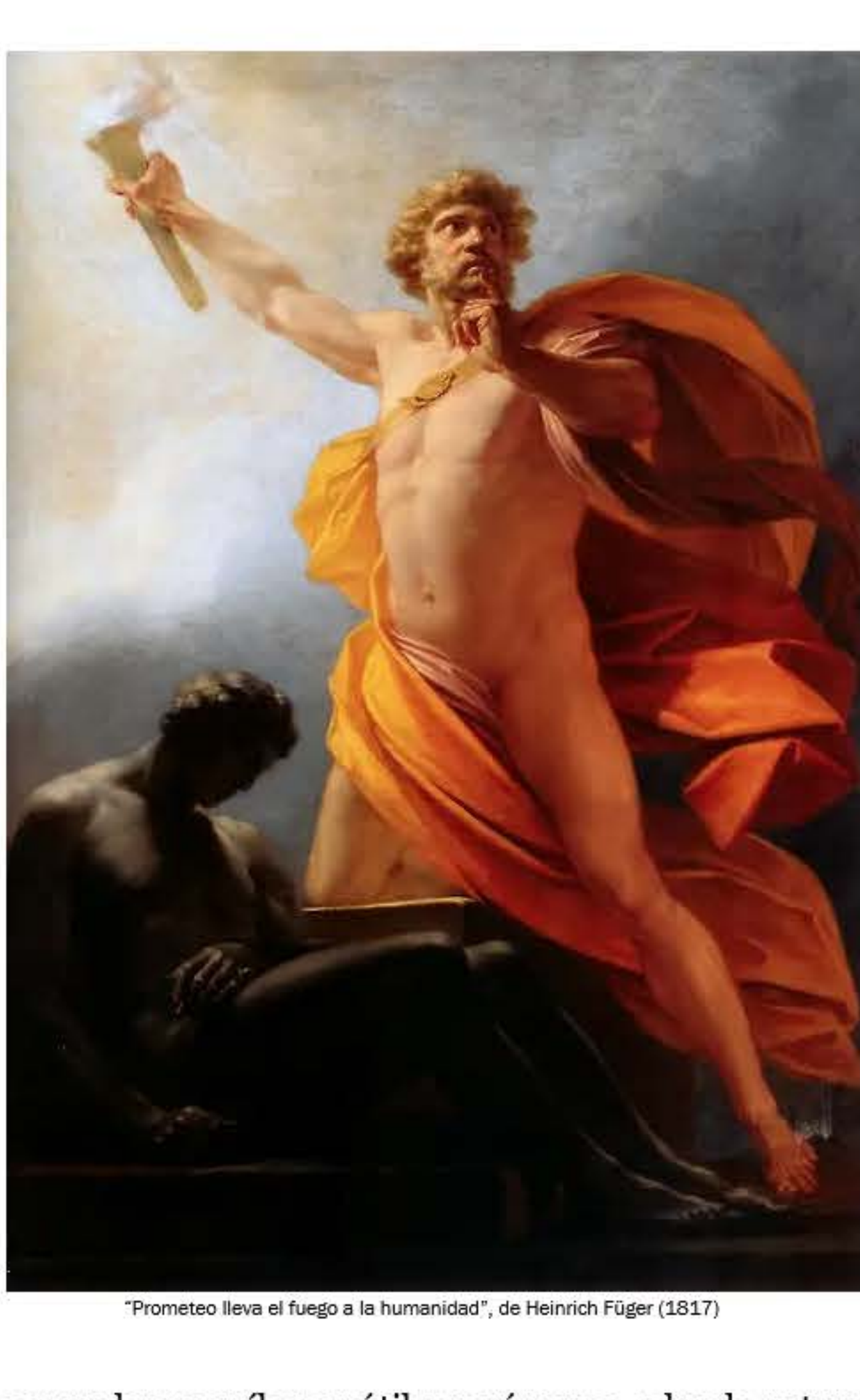
"Prometeo lleva el fuego a la humanidad", de Heinrich Füger (1817)

La pregunta nos lleva directamente al núcleo de la existencia humana. Como afirma Fry, a medio camino: "Lo que de verdad discernimos es un engañoso, ambiguo y caprichoso acertijo de violencia, pasión, poesía y simbolismo que subyace en el corazón del mito griego y se niega a ser resuelto. Como una operación algebraica demasiado inestable como para ser computada adecuadamente, tiene forma humana y forma de dios, no es pura ni matemática". En resumen: los mitos tratan acerca de los misterios que componen la vida humana tanto en la actualidad como lo hicieron en aquel entonces. Los mitos nos permiten, si no resolver estos misterios, al menos visualizarlos.