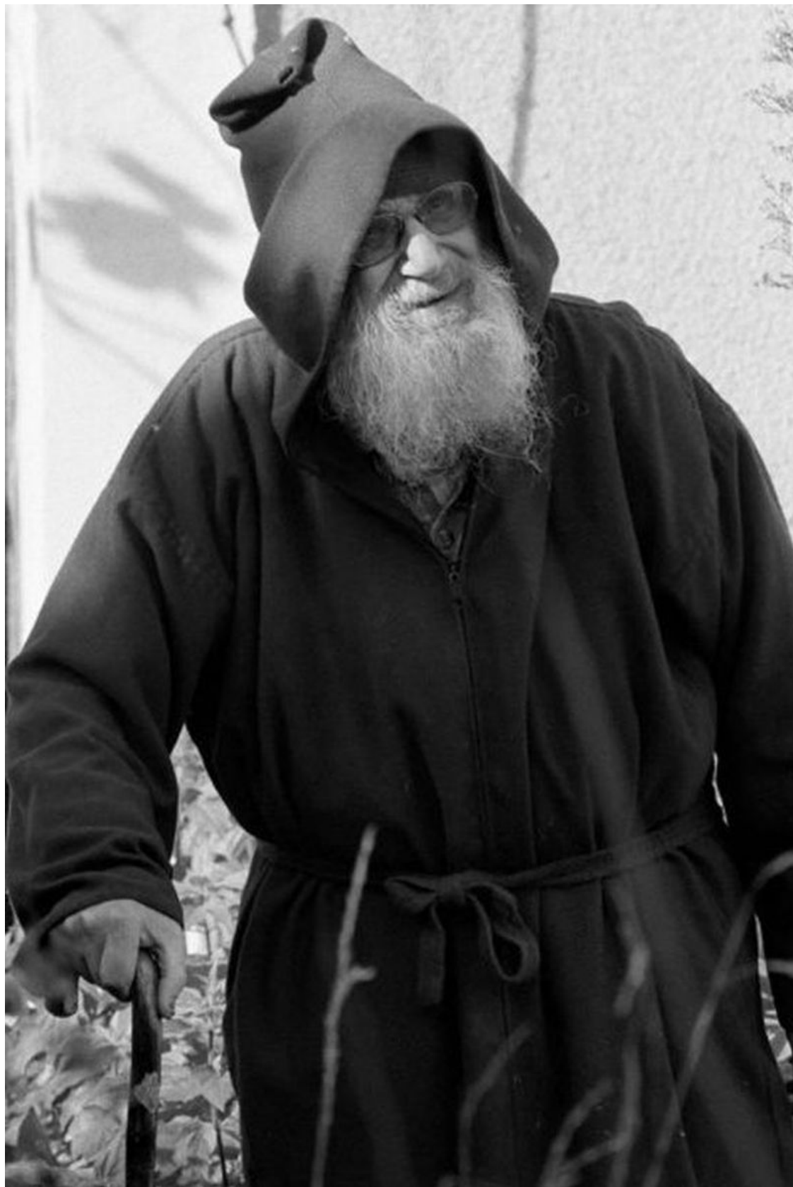
El matemático Alexander Grothendieck, en sus últimos años viviendo como eremita.

-Es un libro que tiene una escritura bastante ágil, ¿cómo se hace para escribir de un tema tan complejo como la ciencia exacta de una forma que resulte atractiva?