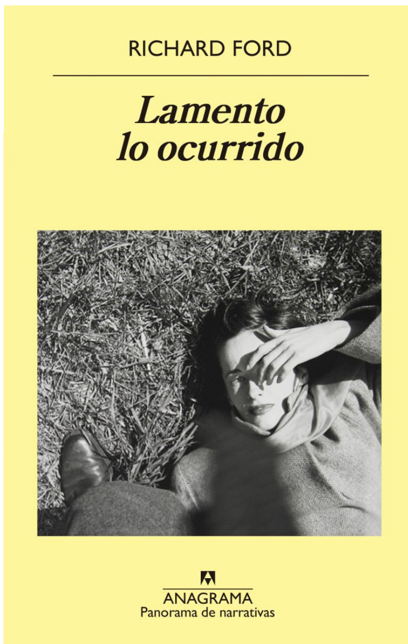
«Lamento lo ocurrido» (2019), de Richard Ford

Asimismo es redactor permanente del Diario Cine y Literatura .