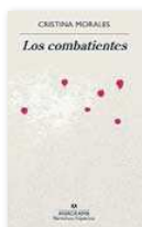
LOS COMBATIENTES CRISTINA MORALES ANAGRAMA 120 PÀG. / 15,90 €

“Hi ha un desig d'escapar dels llops, de reconèixer certa esclavitud de les paraules com a mitjà d'expressió”, assenyala l'autora, que escriu: “Si vostè, escriptor, ha decidit matar les seves paraules i portar-les al taxidermista, no esperi que al cap de cent anys nosaltres, després d'haver escollit a la seva òliba dissecada d'entre tot el que ens oferia l'antiquari, més de treure-li la pols a vostè, hàgim de reviure la seva