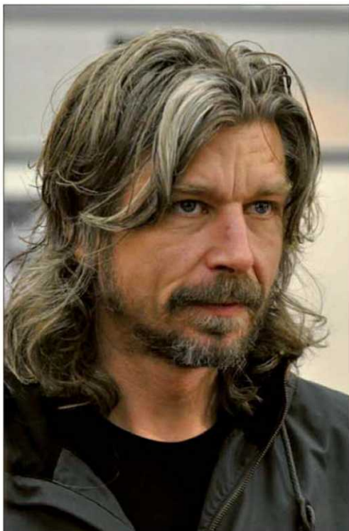
Karl Ove Knausgård.

Una parte importante de Fin , esta sexta entrega de la serie publicada por Anagrama, gira en torno al precio que paga Knausgård por la descarnada franqueza sobre la muer-