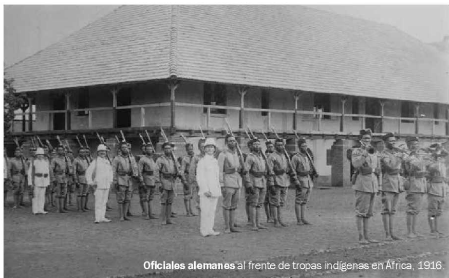
Oficiales alemanes al frente de tropas indígenas en África. 1916.

Pugnas de una mujer en una Alemania nacionalista