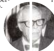
JOSEP L. SERT