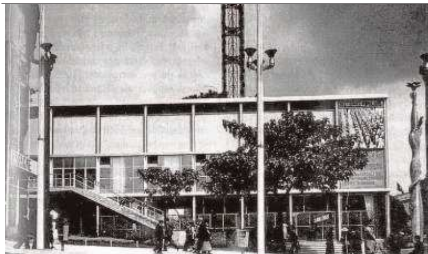
Detalle del Pabellón de la República para la Expo Universal de París de 1937

El relato elaborado por Arnús comienza y termina en Ibiza, donde hoy yacen Sert y su esposa Moncha, figura crucial en la vida de éste. Allí descubrió ese otro mundo que percibía «rigurosamente humilde, antiburgués y representativo de unos valores que coincidían con los que había señalado [Walter Benjamin] acerca de la interacción entre el ser humano, el medio