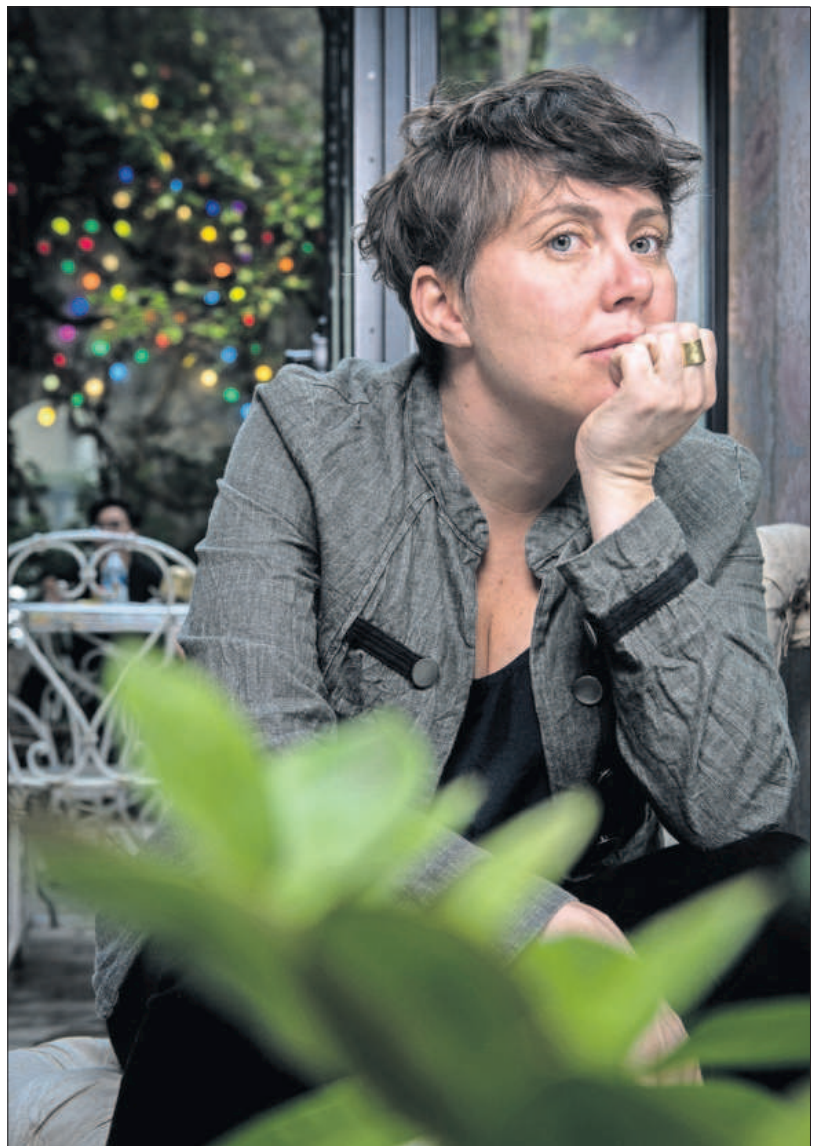
Kristen Roupenian, en París, en la promoción de su libro.

En su libro también se adivina un retrato borroso de la generación que fue adolescente durante los noventa. Maduraron en una década sin terrorismo ni crisis mayúsculas y crecieron esperando sueldos holgados y relaciones igualitarias, pero el desenlace no fue el esperado. “Existía esa retórica que rezaba que todos los problemas habían sido resueltos y que podríamos hacer lo que nos propusieramos. Nos dijeron que las chicas éramos libres de hacer lo que quisiéramos. Cuando nos dimos cuenta de que no era