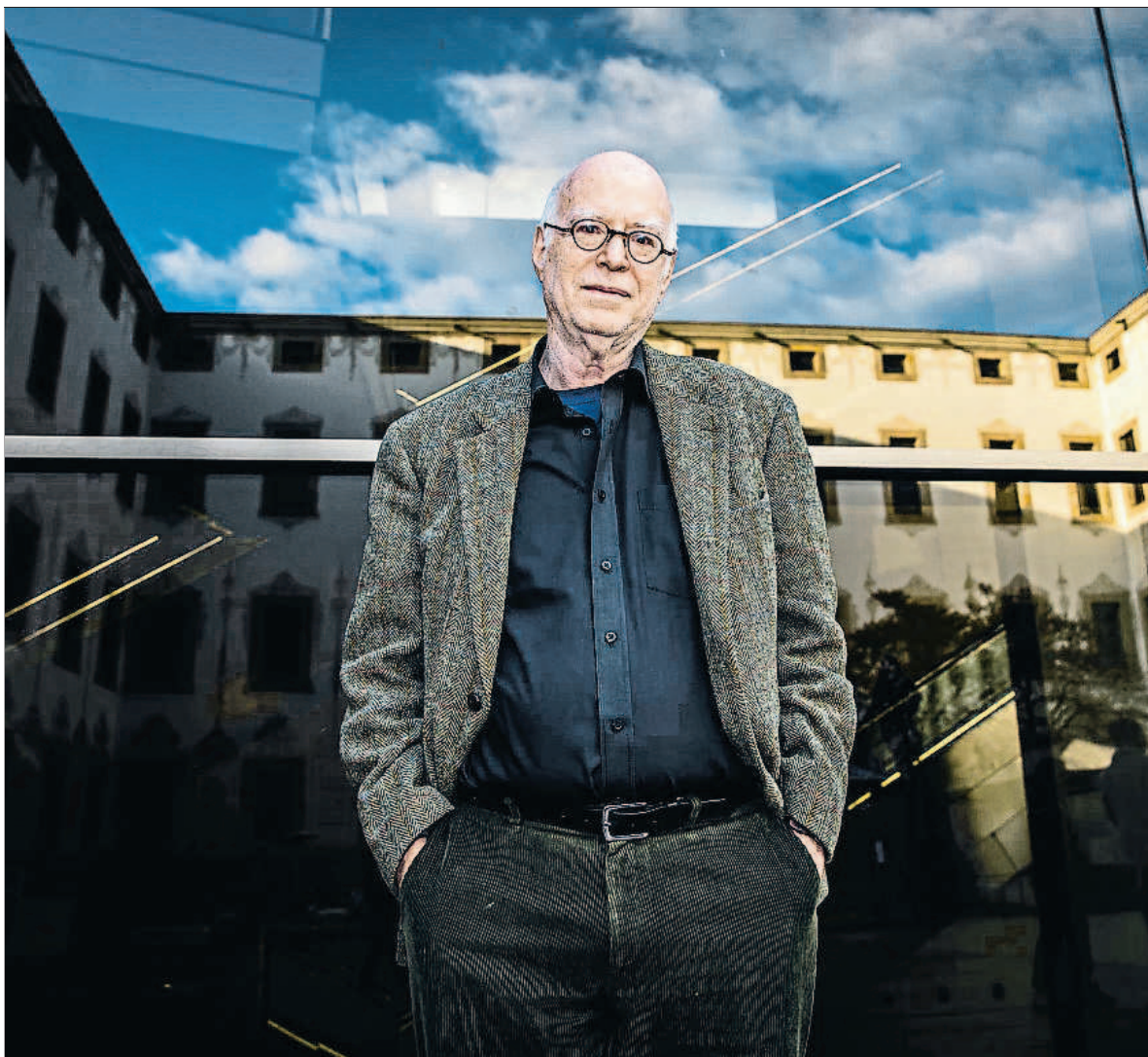
El sociólogo Richard Sennett, fotografiado ayer en el patio del CCCB