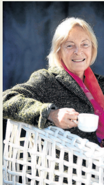
La escritora aragonesa Soledad Puértolas.

Sin embargo, no son esos tres personajes correspondientes a tres arquetipos de mujer los únicos que tienen dificultades para enfrentarse a la vida real. Ese mal lo padecen los mismos hijos de doña Elvira, Justo y Alejo, que se muestran incapaces de dirigir el imperio empresarial paterno y permiten que este caiga en manos de un dudoso administrador, Antonio Perelada, que a su vez pertenece a una de las familias nobles de la ciudad, los Tello, y que da la excusa perfecta para dibujar las diferencias de matiz entre la clase aristocrática y la burguesía próspera en la España anterior a la guerra. Justo y Ale-