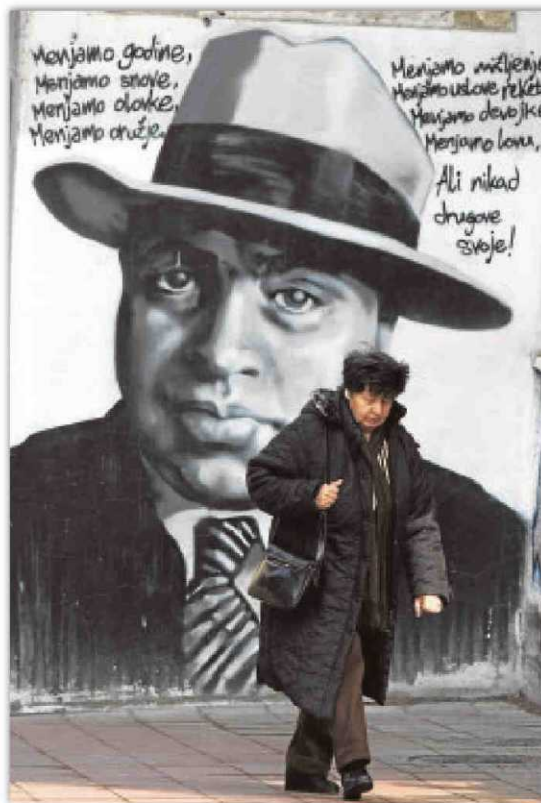
UNA SOMBRA MUY ALARGADA. Arriba, una mujer pasea delante de un grafiti que representa a Al Capone en el «downtown» de Belgrado

Hay dos Al Capones: uno sanguinario, un asesino des-