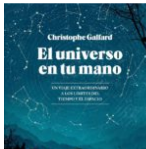
El universo en tu mano, Christophe Galfard