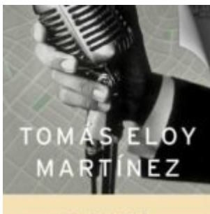
El cantor de tango