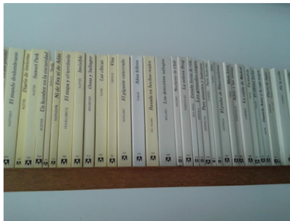
Pequeños actos de rebeldía: Años Felices en el lado de los amarillos