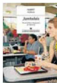
JAMBALAIÀ ALBERT FORNIS ANAGRAMA 304 PÀG. / 19,90 €

El títol del llibre, que també hauria pogut titular-se El trastorn de Fornisnoy , fa referència a un tipus de menjar crioll habitual a Louisiana, una mescla d'arròs, pollastre, ver-