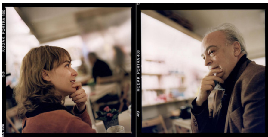
Enrique Vila-Matas y Sara Mesa cara a cara en la Librería Bernat de Barcelona.