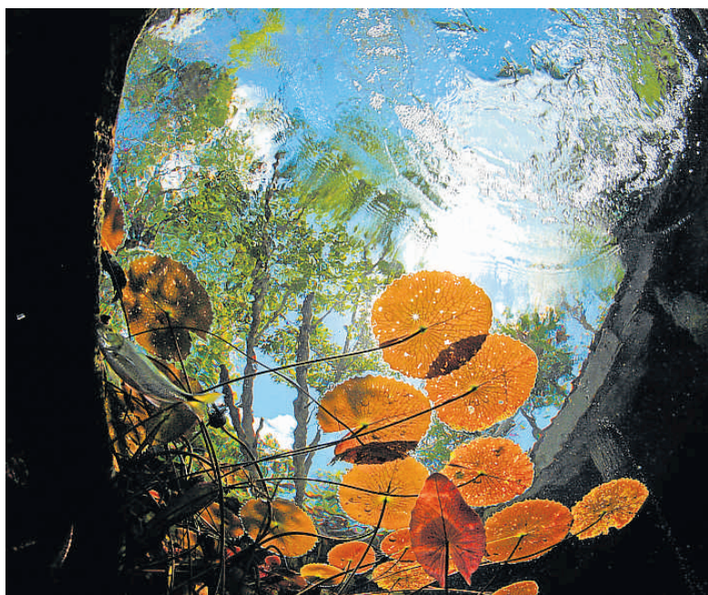
Cenote de Tulum (México), antaño lugar de sacrificios maya