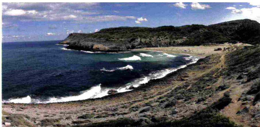
La Spagna balneare che fa da sfondo al libro di Marta Sanz (foto sotto).