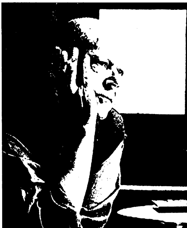
El nuevo libro de Michon ha sido premiado por la Academia Francesa

vez más, diciendo que el autor de Vidas minúsculas y de Cuerpos del rey ha llegado, con su escritura, a donde casi nadie ha llegado; además de añadir, si acaso, sin ironía alguna por nuestra parte, que la confusión que impera desde hace ya demasiados años no solo está haciendo posible que pasen por literatura auténticas mamarrachadas, sino que por lo visto hasta les crea dificultades para reconocer lo excepcional a algunas personas en las que eso resulta raro.