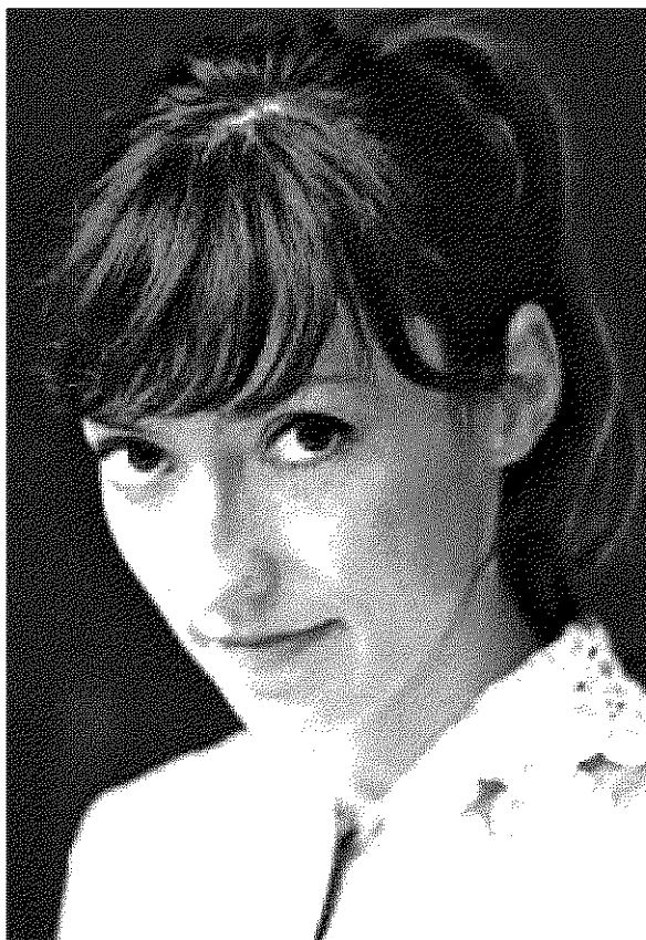
La novela de Charlotte Roche ha arrasado en Alemania

Como cualquiera puede leer en la solapilla, la novela tiene un punto de partida que no engaña a nadie: «Tras causarse una fisura anal por apurar su depilado íntimo...», Helen está en el Hospital. Y nosotros con ella. No saldremos de allí durante toda la novela y tendremos tiempo para conocer las dos cosas