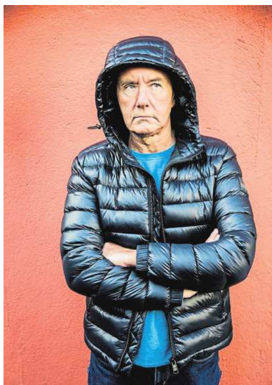
El novelista, en una de sus últimas visitas a Barcelona

Pero no hay redención, al menos en esta saga, solo cuentos, excusas y explicaciones. Y ojo con insistir en no reservar las vacaciones con un año de antelación, en no preocuparte por los tipos de interés, en no comparar los precios de las lavadoras. Soren Kierkegaard escribió que la gente que se atreve a conquistar la libertad es tachada de excéntrica, y si insiste, de enferma, y si persiste, pues de delincuente, porque nuestro re-